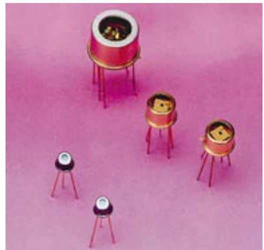
Bild 3: Verschiedene Aufbauten von spektroskopischen NIR Lasern mit und ohne Peltierstabilisierung (Baureihen SPEC-DILAS-V und SPEC-DILAS-D).