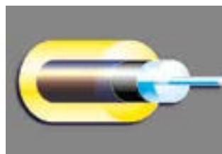
Der typische Aufbau einer Faser für geophysikalische Anwendungen besteht aus einem Quarzkern mit Quarzmantel, einer hermetischen Kohlenstoffschicht und einem Polyimid-Buffer.

Dieser dimensionslose Parameter hat einen Wert von etwa 20 für eine mit Acrylat, Silikon, oder Polyimid beschichtete