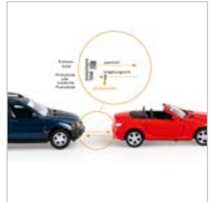
Abbildung 2: Abstands- und Relativgeschwindigkeitsmessung im Automobilbereich