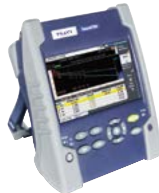
Abbildung 2: Smart-OTDR für einfache PON-Netz-Zertifizierungen