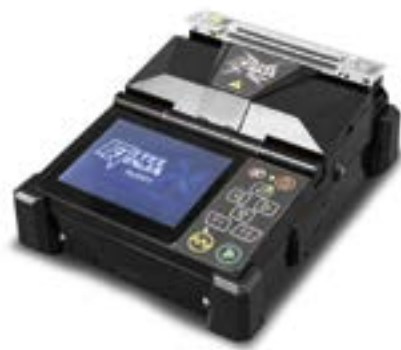
Abbildung 1: FTTH-Spleißgerät FITELE Ninja

Bei der Wahl der richtigen Messtechnik muss man die Zertifizierungs- und Dokumentationsanforderungen der Netzbetreiber berücksichtigen, die sich teilweise sehr stark unterscheiden. Dennoch gelten für die erfolgreiche Abnahme stets die folgenden Kriterien: Ist das Netz korrekt konfiguriert? Werden die Spezi-