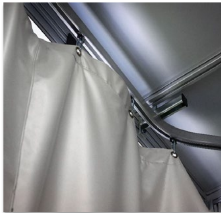
Laserschutz-Vorhang inkl. Schienensystem