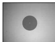
Gut oder Schlecht?