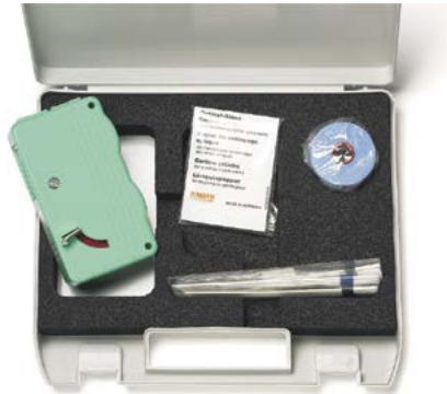
Reinigungsset für optische Steckverbinder OCK-10