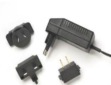
Weltweit einsetzbares AC-Netzteil/-Ladegerät (SNT-121A)