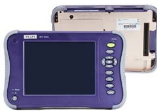
Rückseite des Modulträgers mit installierten Modulen

Aufgrund ihres multidimensionalen Designs bietet die Plattform MTS-6000A (V2) eine optimale Konfigurationsflexibilität mit einer längeren Batterielebensdauer. Der Modulträger E6100 ist ideal für Glasfaser-tests geeignet, während der Hochleistungsakku im Modulträger E6200 bei Verwendung mit dem Modulträger für Ethernet (MSAM) oder anderen leistungsintensiven Glasfaseranwendungen einen langen, netzunabhängigen Betrieb gewährleistet.