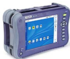
MTS-6000A Kompakte Netzwerk-Testplattform