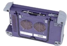
Transport- und Glasfaser- Modulträger E6300

MTS-6000A Kompakte Netzwerk-Testplattform