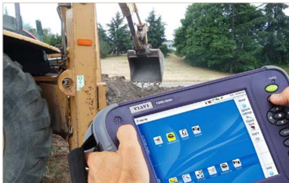
Die portable, erweiterbare Plattform mit austauschbaren Testmodulen erhöht die Produktivität der Techniker

Die von den austauschbaren Modulträgern und den verschiedenen Moduleinschüben gebotene Flexibilität versetzt die Anwender in die Lage, eine Plattform aufzubauen, die ihren spezifischen aktuellen Testanforderungen gerecht wird. Gleichzeitig lässt sie sich nahtlos an die zukünftigen Bedürfnisse der sich dynamisch verändernden Netzwerke anpassen.