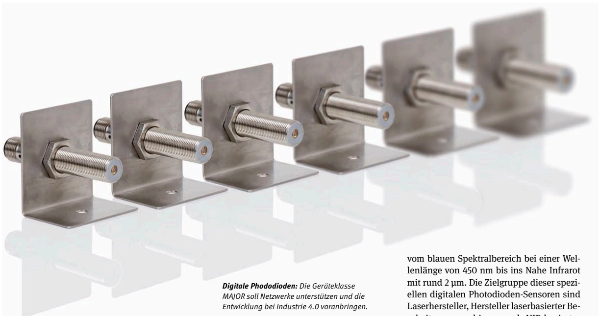
Digitale Photodioden: Die Geräteklasse MAJOR soll Netzwerke unterstützen und die Entwicklung bei Industrie 4.0 voranbringen.

vom blauen Spektralbereich bei einer Wellenlänge von 450 nm bis ins Nahe Infrarot mit rund 2 \mu\text{m} . Die Zielgruppe dieser speziellen digitalen Photodioden-Sensoren sind Laserhersteller, Hersteller laserbasierter Bearbeitungsmaschinen und NIR-basierter Mess- oder Überwachungstechnik.