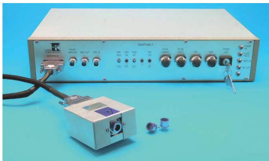
Bild 4. Der Genpulse ermöglicht einen komfortablen und einfachen Betrieb von QCLs der Quanta-Serie

Ein guter Single Mode (SM) VCSEL der Specdilias-V-Serie hat eine Bandbreite von unter 30 MHz (oder in Kohärenzlängen umgerechnet von mehreren zehn Me-