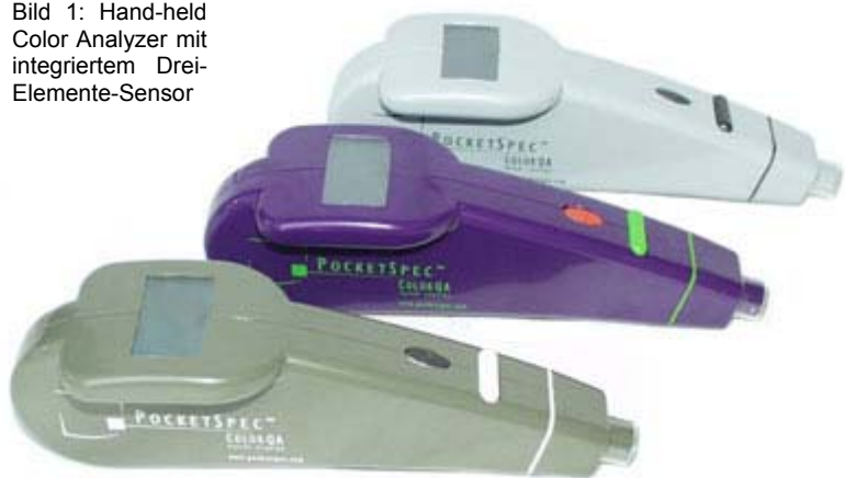
Bild 1: Hand-held Color Analyzer mit integriertem Drei-Elemente-Sensor

Farberkennungsaufgaben ergeben sich quer durch alle Branchen. Typische Einsatzgebiete für Farbsensoren sind die Prozessüberwachung und -steuerung in automatisierten Anlagen zur Produktion von farbigen Massengütern oder Produkten mit Farbanteil an der Oberfläche. So können die Sensoren in der Pharmazie so genannte Farbring-Codes auf Arzneiflaschen erkennen und nicht nur auf Einhaltung der Farbnuancen, sondern auch auf Anwesenheit, richtige Positionierung oder Beschädigung prüfen. Andere Anwendungen sind die Erkennung oder Überprüfung bestimmter Farbreihenfolgen, etwa von farbigen Pillen in der Verpackung, oder die Bestimmung der Farb-Codes auf der Verpackung (Bild 1).