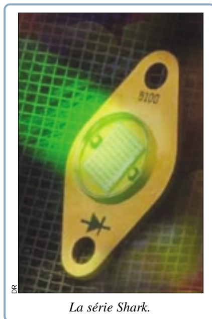
La série Shark.

Sur la base de plus de 30 ans de recherche et de développement dans le do-