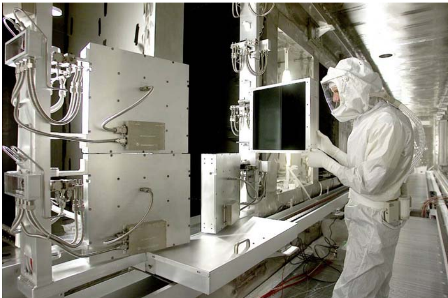
Abbildung 1: Ein Techniker testet vier große Kalorimeter von Gentec-EO in der National Ignition Facility.

es Produkt zu entwickeln, gilt es, Geräte herzustellen, die sich entsprechend der wachsenden Anforderungen weiterentwickeln lassen. Ein Beispiel hierfür sind tragbare Leistungsmessgeräte, die auf dem Betriebssystem Windows CE basieren. Ändern sich die anwendungsspezifischen Anforderungen, kann die Funktionalität des Monitors durch Download einer neuen Softwareversion von einer Website modifiziert beziehungsweise erweitert werden. Auf diese Weise steht dem Anwender über einen langen Zeitraum die jeweils neueste Technologie zur Verfügung, und seine Investition zeigt eine weitaus höhere Rentabilität.