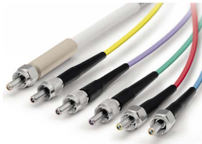
Bei Laser Components wird eine große Bandbreite an Lichtleiter-Assemblies hergestellt, neben den Faserdurchmessern unterscheiden sich auch die Ummantelungen je nach Anwendungsfall.

Eines scheint jedenfalls klar: der Leistungsbedarf von Laser-Anwendungen wird trotz oder gerade wegen des unaufhaltbaren Trends zur Miniaturisierung weiter zunehmen. Damit entscheiden immer häufiger nicht nur die Lasertechnologie, sondern auch die Lichtleiter, was technisch möglich ist. CB