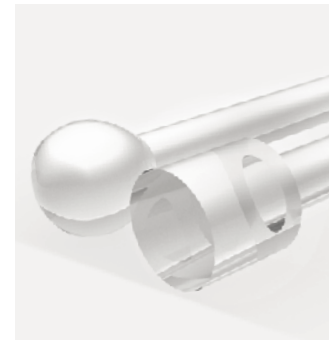
Endcaps reduzieren die Energiedichte bei der Einkoppelung des Laserstrahles.

Zwar ist prinzipiell das gesamte Portfolio der optischen Beschichtungen auch auf einer Faser denkbar, doch im Gegensatz zu den großflächigeren Laseroptiken führt bei zunehmender Schichtdicke der geringe Faserdurchmesser zu unerwünschten geometrischen Nebenwirkungen. Denn je mehr sich die Schichtdicke an den Durchmesser der Faser annähert, umso stärker wirken sich Effekte wie die Schichtspannung aus. Deshalb ist noch einiges an Entwicklungsarbeit