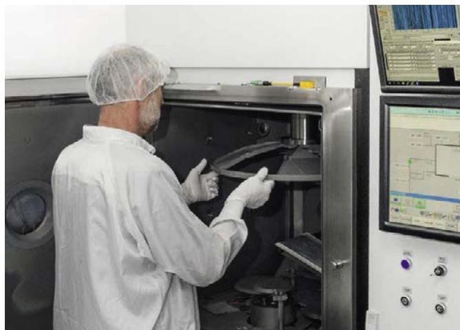
Um die Restreflexion an den Übergangflächen zu minimieren, werden die Faserenden von Lichtleitern im Vakuum mit dielektrischen Schichten bedampft. Dadurch kann die Restreflexion von 4 auf unter 0,5 Prozent reduziert werden.

Beim Polieren einer Faser-Optik kommen drei Mechanismen zum Tragen, zum einen ein verfeinertes Schleifen, eine Wärmeumformung und ein chemisch-physikalischer Prozess zwischen Poliermittelträger, Poliermittel und der Glasoberfläche. Bei letzterem entsteht eine Art Kieselgelschicht, die in die Kapillarrisse eindringt, die durch den Schleifprozess erzeugt wurden und dann