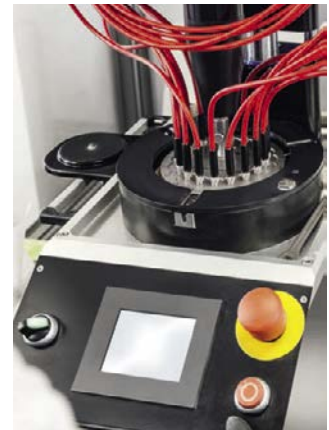
Eine spezielle Aufnahmevorrichtung gewährleistet beim Polieren die exakte Ausrichtung der Stecker zur Polierebene.

Somit ist das Einkleben der Fasern in die jeweiligen Stecker ein erster und sehr entscheidender Schritt für die spätere Güte eines solchen Faser-Assemblies. Geschulte Fachkräfte schaffen es bei Laser