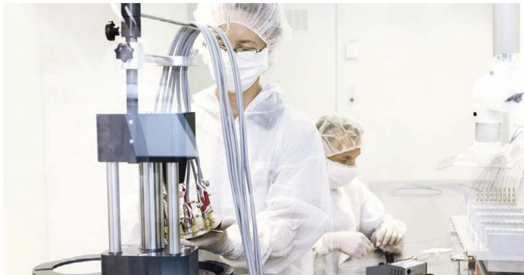
Der Polierprozess der Glasfaser-Enden erfolgt mit feinen Oxiden. Im Bild wird gerade eine Poliermaschine für den Betrieb vorbereitet. In die Vorrichtung rechts im Bild werden die frisch verklebten Stecker eingesetzt und unter gezielter Wärmeeinbringung ausgehärtet.

Lichtleiter sind in vielen Anwendungen durchaus als Verschleißteil zu betrachten, und insofern müssen bei wertvollen und hochpreisigen Lasersystemen auch im Feld mitunter neue Lichtleiter eingebaut werden. „Es besteht längst ein umfangreiches Discount-Angebot aus dem asiatischen Raum“, berichtet Hornsteiner. „Allerdings ob und welche Qualitätskriterien diese